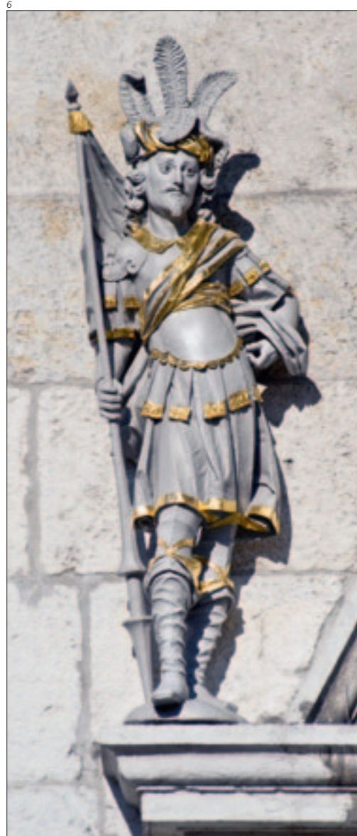
Abb. 6 Die Figur des hl. Urs nach der Aufstellung, mit wieder hergestellter Fassung, Vergoldung und Gesichtszeichnung. Foto 2011.