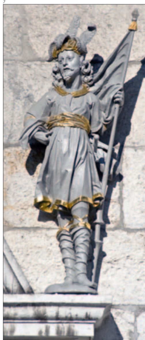
Abb. 7 Die Figur des hl. Viktor nach der Aufstellung, mit wieder hergestellter Fassung, Vergoldung und Gesichtszeichnung. Foto 2011.