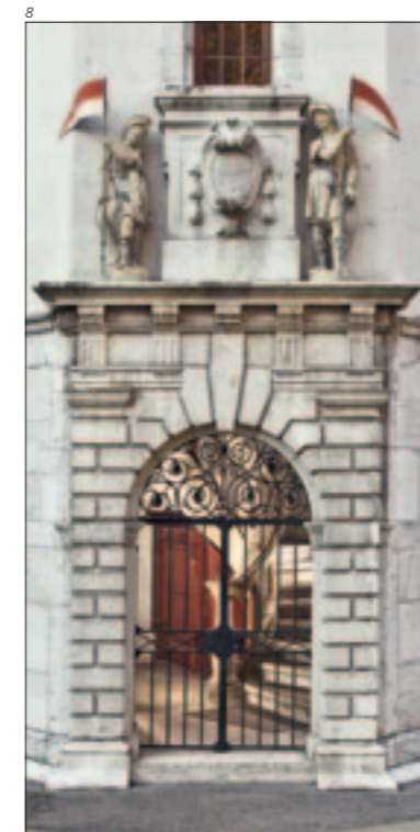
Abb. 9 Die Steinskulpturen vom Rathausportal, 1640, von Hans Heinrich Scharpf geschaffen. Foto 2009.