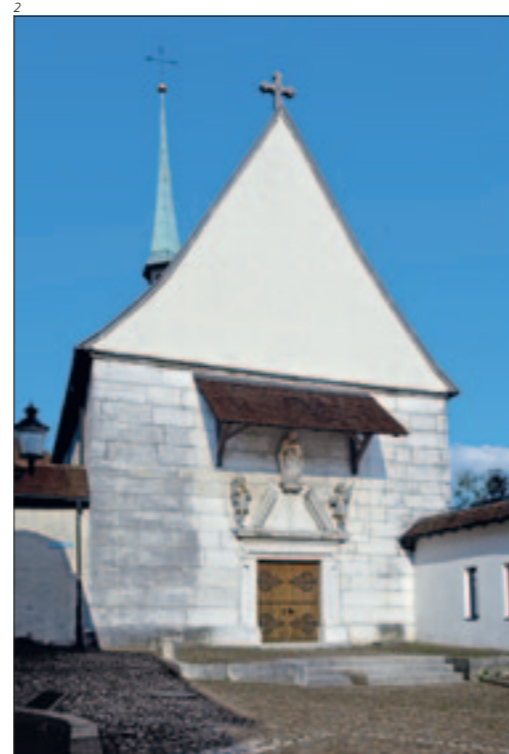
Abb. 2 Solothurn, St. Peterskapelle. Westfassade mit Portal von 1654 und Portalfiguren: der Apostel Petrus (oben) und die Thebäermärtyrer Urs (links) und Viktor (rechts). Foto 2011.