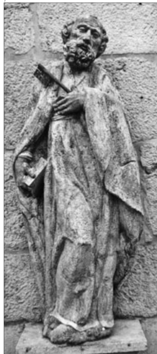
Abb. 1 Solothurn, St. Peterskapelle. Die Portalfigur des Apostels Petrus, aus ungefasstem Kalkstein mit Resten von Ver- goldungen an den Gewand- säumen und Attributen. Foto um 1972.

Die Holzskulpturen der Stadtheiligen Urs und Viktor befinden sich seit ihrer Restaurierung 2008–2010 wieder am Portal der St.Peterskapelle. Mit der zentralen Steinfigur des Apostels Petrus gehören sie zur Portalgestaltung des 17. Jahrhunderts. Von verschiedenen Bildhauern stammend, geben uns diese Werke ein Bild der solothurnischen Kunstlandschaft in der ersten Blütezeit der Barockskulptur.