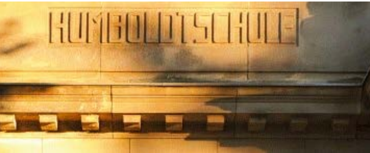
Schriftzug am Humboldt-Gymnasium