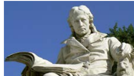
Wilhelm von Humboldt, Denkmal von Paul Otto vor der Humboldt-Universität Unter den Linden aus dem Jahr 1883