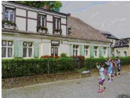
18 | Den Humboldts auf der Spur

Wo und wie lebten die Brüder Alexander und Wilhelm von Humboldt? Wie sind sie so bekannt geworden? Welche Spuren haben sie in Tegel hinterlassen? Hat es in Tegel gespukt? Und woher hat die Dicke Marie ihren Namen? Wenn du zwischen 8 und 13 Jahre alt bist, gerne knifflige Rätsel löst und Detektiv spielst, dann kannst du dich an diesem Samstag bei einer Schnitzeljagd auf die Spuren der berühmten Brüder Wilhelm und Alexander von Humboldt in Tegel machen.