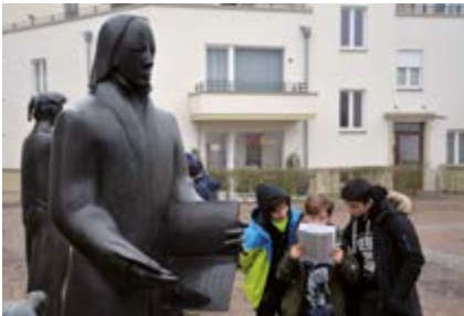
Humboldt-Schüler bei der Recherche

Schülerinnen und Schüler des Humboldt-Gymnasiums stellen ihre Ideen für einen webbasierten interaktiven Parcours „Auf den Spuren der Humboldts in Berlin – Tegel“ vor. Auf diesem können Kinder und Erwachsene wandeln und sich über das vielfältige Leben und Wirken der Brüder Wilhelm und Alexander von Humboldt informieren. Das Projekt entwickeln Schülerinnen und Schüler des Humboldt-Gymnasiums über einen Zeitraum von zwei Jahren. Abschluss wird der 250. Geburtstag Alexander von Humboldts im Jahr 2019 sein.