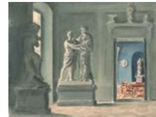
Max Grunwald o.T. Aquarell 1953

Als Humanist ehrte Wilhelm von Humboldt das antike Griechenland und sah im Dialog und in der Sprache eine besondere geistige Herausforderung. Wissen durch Sprachkraft vermittelt reize den Geist mehr als verstaubte Bücher. Die Kunstkomplizen lassen nun Wilhelms stumme Schriften wieder „zur Sprache kommen“. Eintritt frei